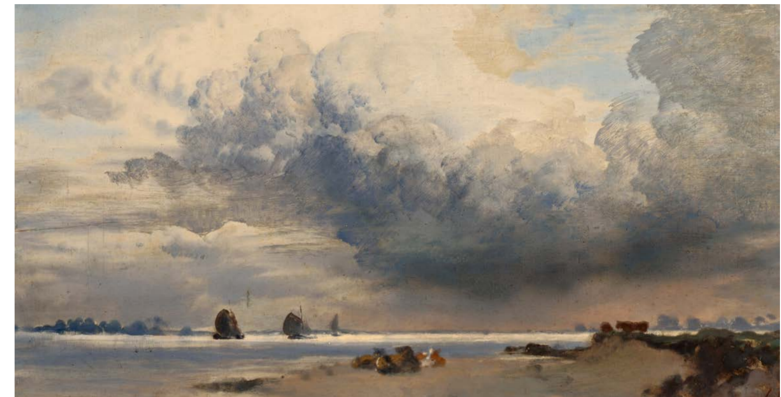
Jan Voerman sr.